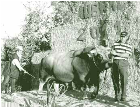
DRAKKAR — Prix de Championnat Mâle