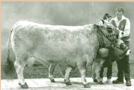
Femelle : ALPINE — JEAN-MARIE VIDALENC