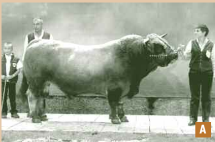
A - TAUREAUX JEUNES CARAMEL — EARL BESSON